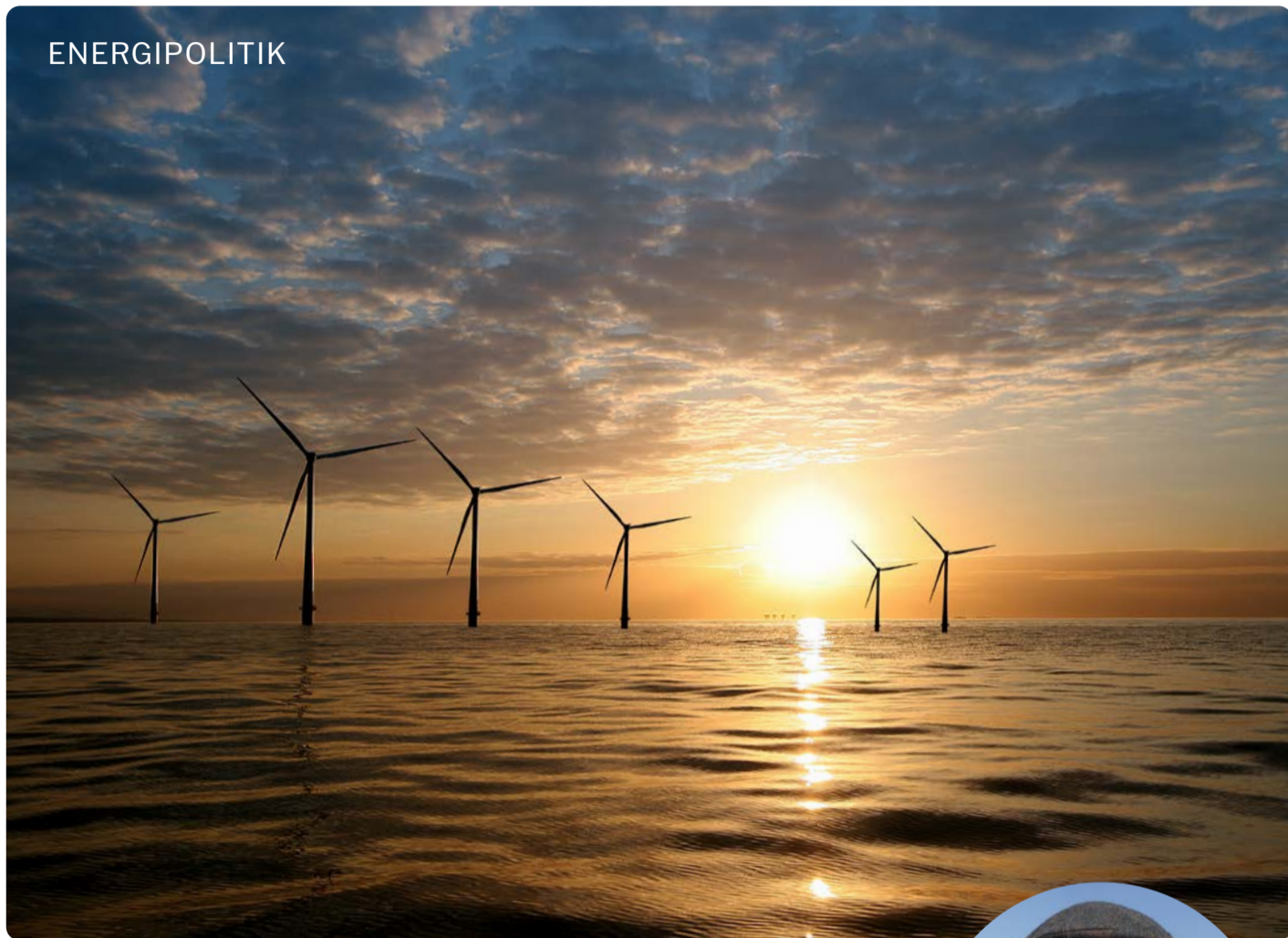
Vindkraft. Företaget Eolus vill bygga en vindkraftspark i Kattegatt som årligen skulle producera 4-4,5 TWh per år - motsvarande hela Göteborgs stads förbrukning.