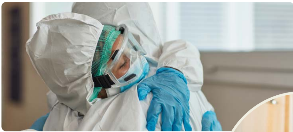
Pandemin visade på bristerna i välfärden. Vänsterpartiet vill bygga samhället starkt igen.

att välfärden ska bli sämre hela tiden, det beror helt på politiska beslut. Vi måste ta tillbaka kontrollen över skola, vård, omsorg och infrastruktur. Det fungerar inte att ge mindre och mindre pengar till verksamheter som dessutom ska ge en allt större andel av de pengarna till privata bolagsvinster. Det har slagit sönder välfärden och skapat otrygghet.